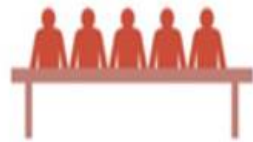
President / Regering